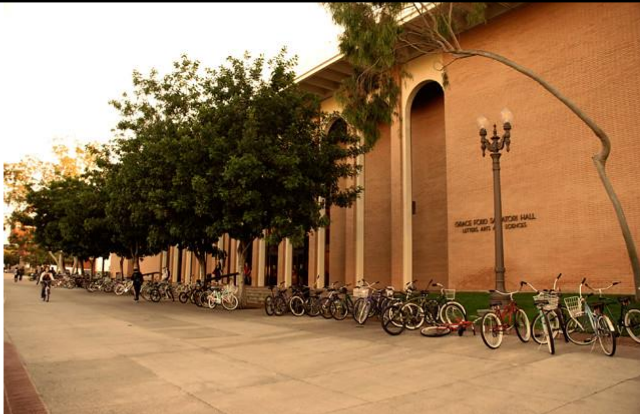
2019 Hsing-Hau Chen