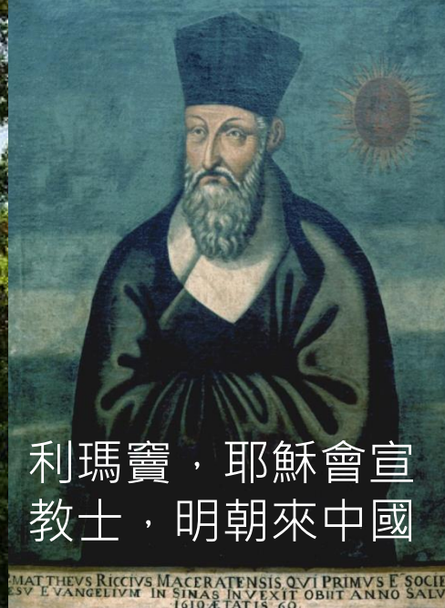
利瑪竇，耶穌會宣 教士，明朝來中國