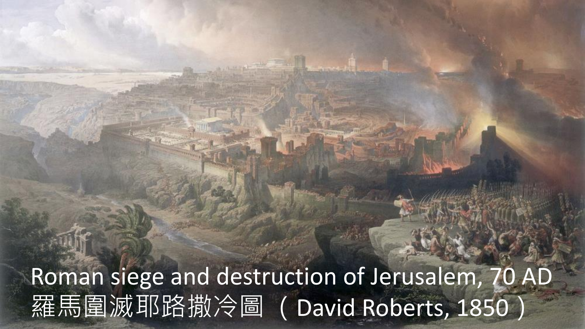
Roman siege and destruction of Jerusalem, 70 AD 羅馬圍滅耶路撒冷圖（David Roberts, 1850）