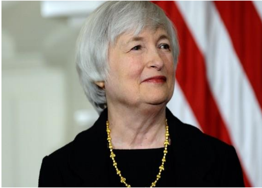
國儲會主席 Janet Yellen “The hand on the lever”- The New Yorker