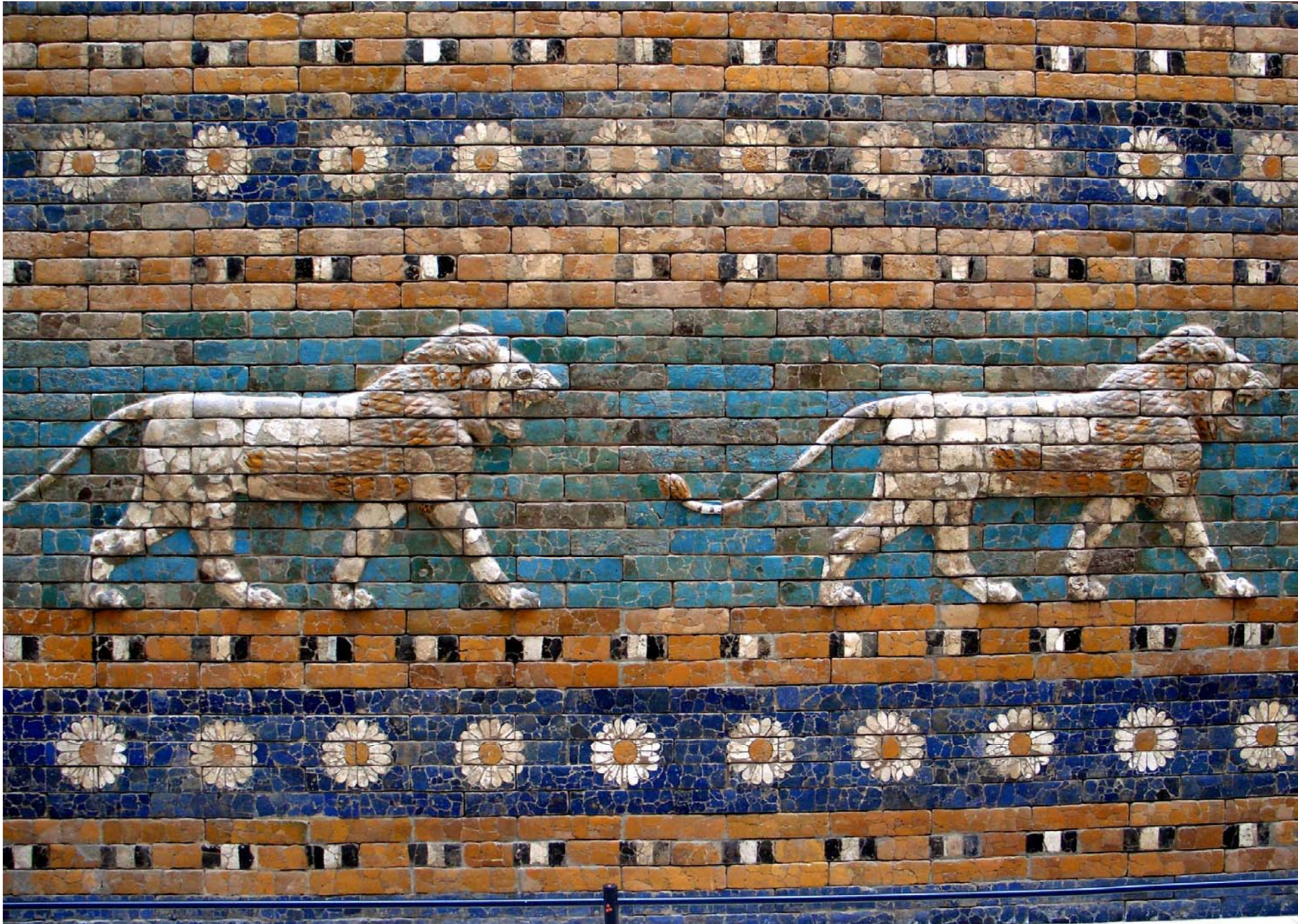
Berlín - Pergamon - Porta d'Ishtar - Lleons