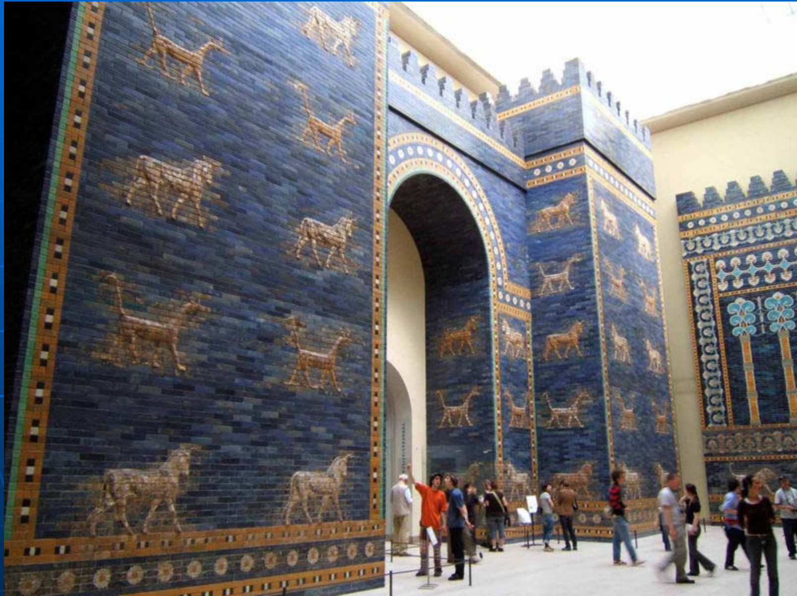
巴比倫城門，佩加蒙博物館，柏林 Ishtar Gate at Berlin Pergamon Museum