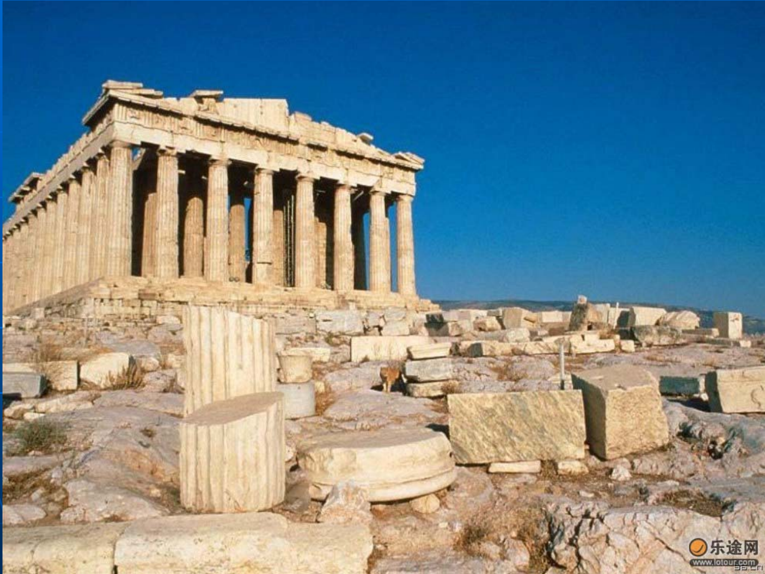
巴比倫 (Babylon) 古城遺址