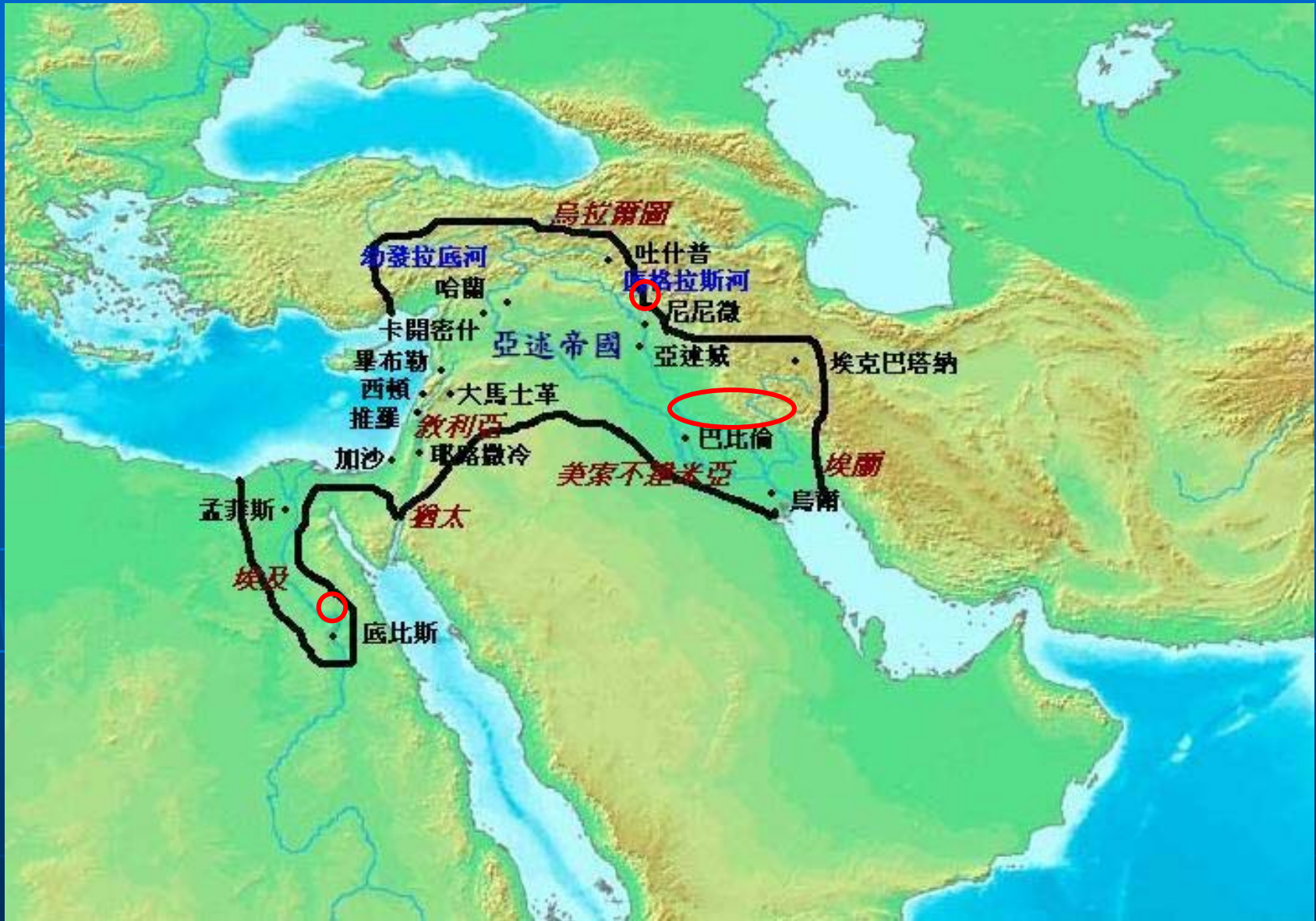
亞述班尼帕時期的亞述帝國（公元前668-626年）