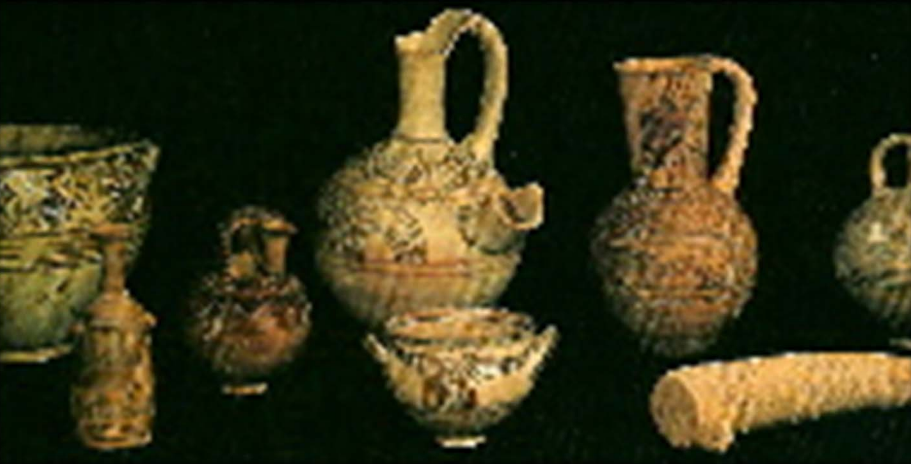
非利士人的文物：陶瓷器